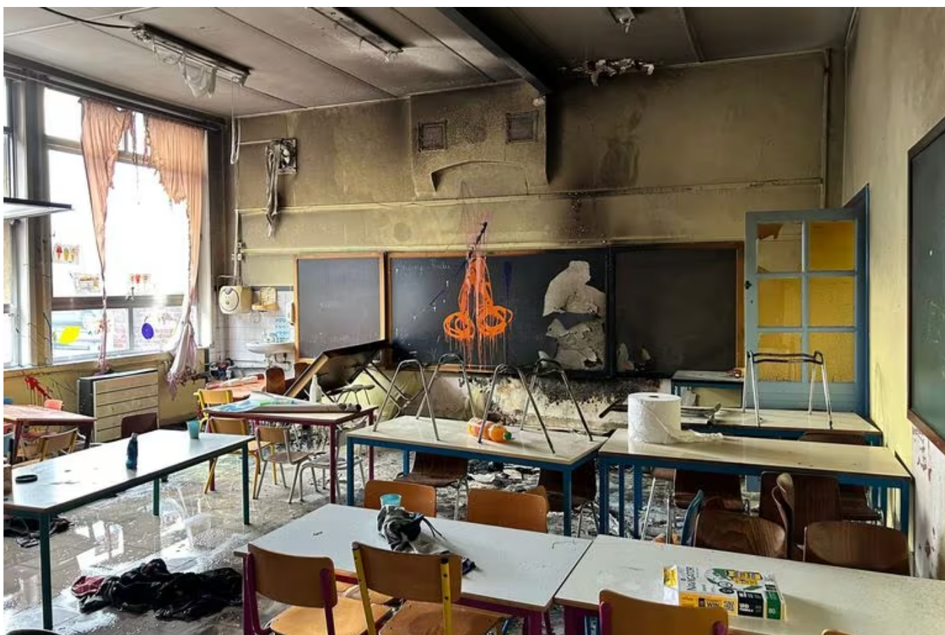
Le réfectoire de l'école du Champ Perdu avait été incendié et saccagé.